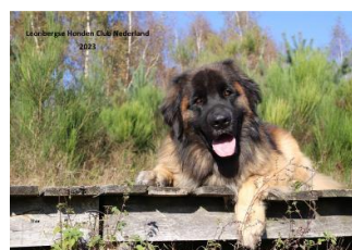
Winnaar kalender 2023 Thor