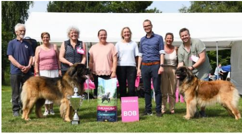
Links CW 2022 Rosaceae Oreocereus

De Clubwinnaar 2022 was Rosaceae Oreocereus .