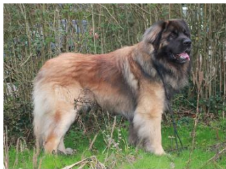
Jupi Jaj Jej Brut Grande Leonis

De Jeugdladder reuen werd gewonnen door Jupi Jaj Jej Brut Grande Leonis en de Jeugdladder teven werd gewonnen door Kiss Me Once van Tregelaar . Zij mogen beide mee doen aan de grote ladders.